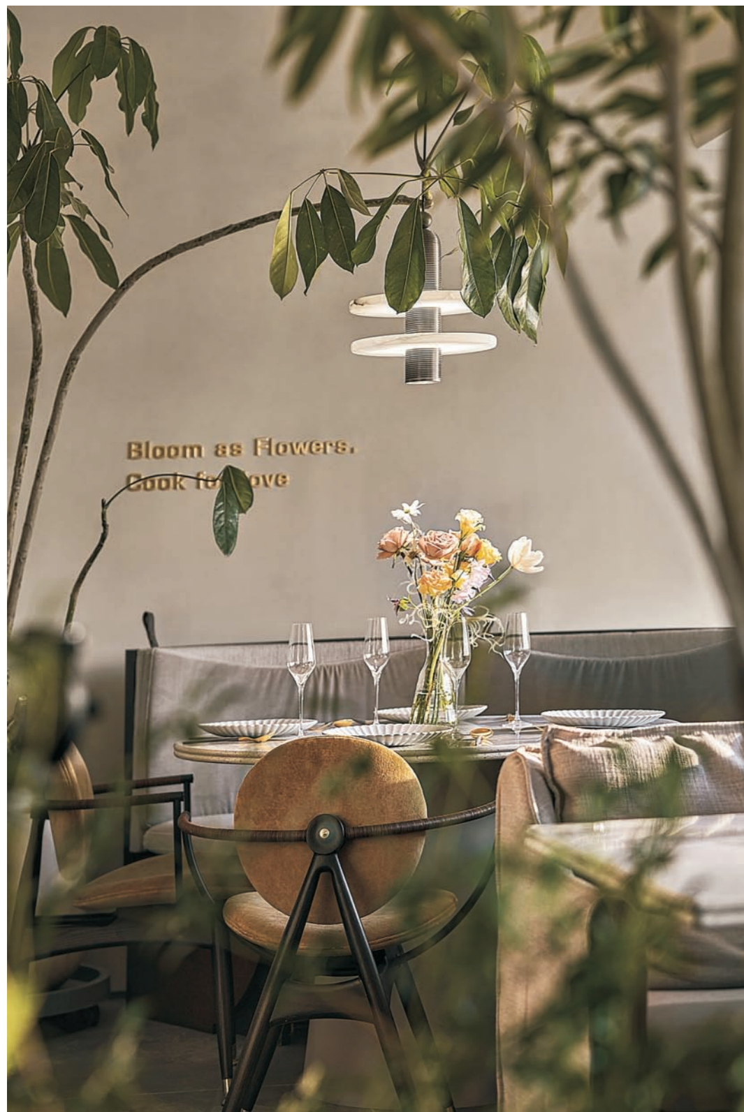
图 将西湖美景元素融入空间之中，营造优雅氛围