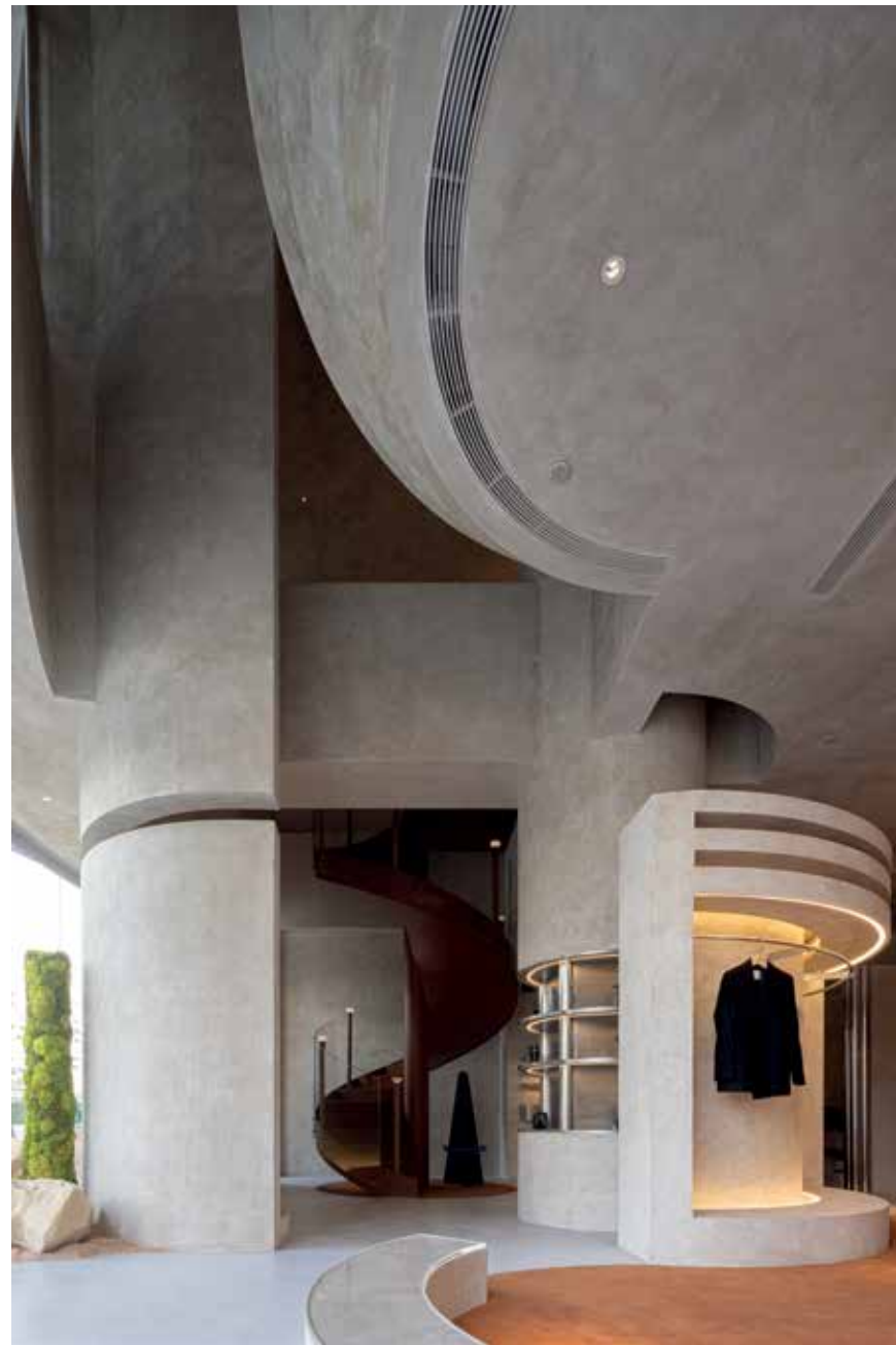
Large steel and micro-cement structures , celestial lighting and symmetrical layouts add a ceremonial touch to the shopping experience at this clothing store in Hangzhou, China